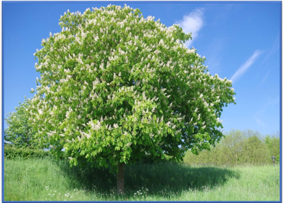
Thorn - De Grote Hegge