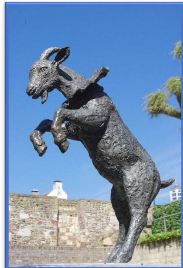
v.l.n.r.: Ode aan de Muziek - Ansfried - Geitebok